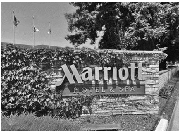
図1 会場となったNapa Valley Marriott Hotelのエントランス付近