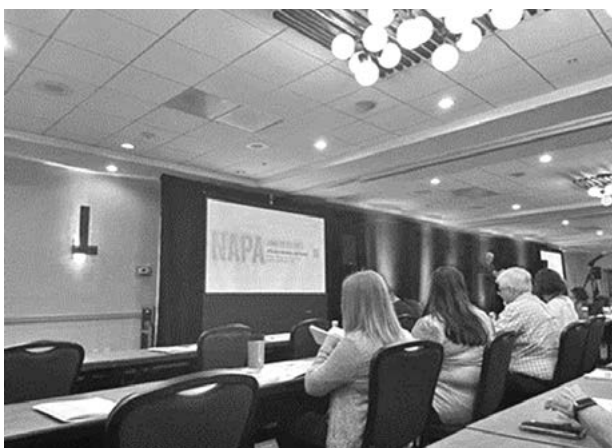
図2 Climate Change Symposium開催直前の会場の様子 (Napa Valley Marriott Hotel, Napa Valley Ballroomにて)