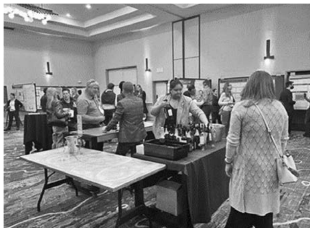
図4 Poster Authors Presents & Napa Valley Regional Wine Receptionの様子 (Napa Valley Marriott Hotel, Grand Ballroomにて)