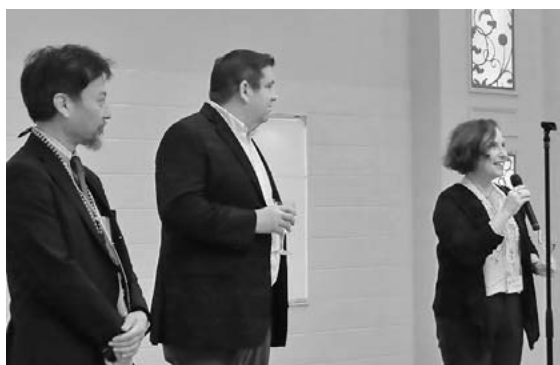
研究会(懇親会)会場:バルクラシック甲府