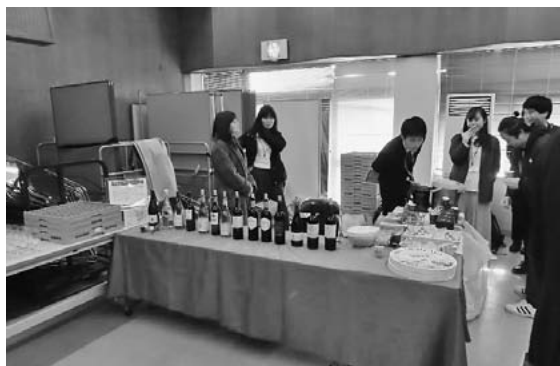
ポスター発表会場 ワインおよび軽食