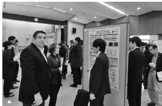
ポスター発表の様子