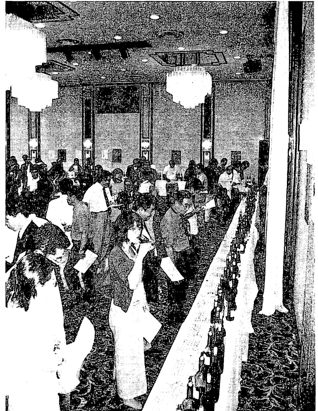
写真④ 公開テイスティング

昨年の第1回に引き続き2回目を開催することができた。実行委員会の立ち上げが少し遅かったので心配したが、出品数は前年度を若干下回る程度でよかった。出品ワイナリーの減少は少し心配になるので、今後その理由等を把握して対処することが必要であると考えられる。私事ではあるが、第2回目は職務の関係で、審査方法の改正や外国人審査員との交渉以外の部分には十分に関与できませんでしたが、事務局の山梨県工業振興課や山梨県ワインセンター、山梨県ワイン酒造組合ならびに山梨大学ワイン科学研究センターの関係者の裏方の支えにより円滑に進行できたことに対しまして心から御礼申し上げます。また出品ワイナリーの各位にも感謝するとともに今後の本コンクールの発展・定着にご支援・ご協力のほどよろしくお願い申し上げます。