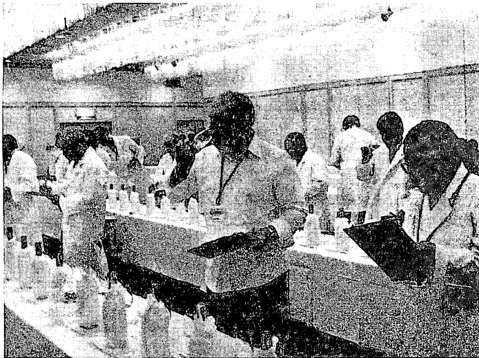
写真① 一次審査風景